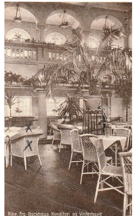
Ribe. Fra Backhaus Konditori og Vinterhave

stedet en indendørs vinterhave gående gennem to etager og indrettet som en palmehave efter tidens stil. Efterhånden udviklede stedet sig til et større forlystelsesetablisement med indendørs palmehave og udendørs