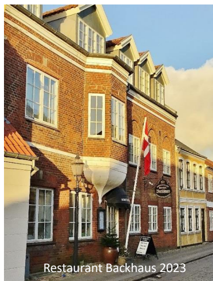
Restaurant Backhaus 2023